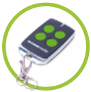
2 Controles remotos inalámbricos ALS4