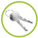
2 Llaves manuales