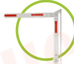
Brazo articulado 4 metros BOOM04T