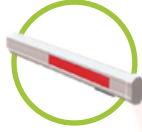
Brazo telescópico 6 metros BOOM06T