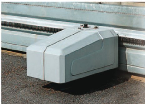
MEC 200 horizontal

Sin duda, este es el mejor equipo de su clase existente en el mercado.